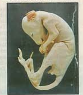
Een embryo van een kangoeroe op formol.