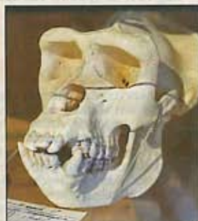
De schedel van Gust.