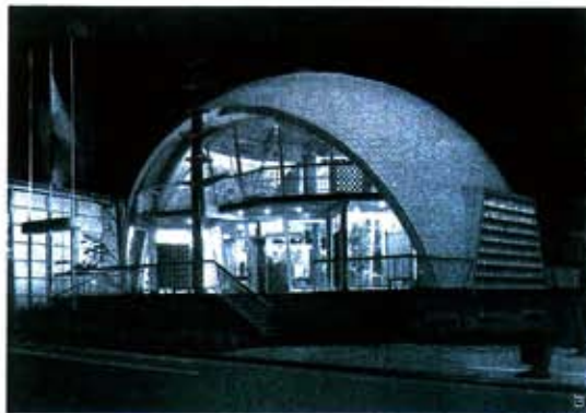
Op Expo 58: het Kortijs Dakpannenkantoor van Geo Bontinck en een passerelle met de typische houtenspanen. En de prachtige trap van Willy Nel in het huis De Westhinder in Knokke, ontworpen door Van de Velde.