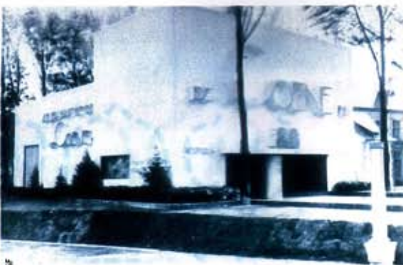
Realisaties van De Coene: de imposante hal uit 1927 van de villa Verbreyt in Sint-Niklaas, het De Coenepaviljoen op de wereldtentoonstelling van 1935 in Brussel, de gemeenteraadzaal van Vorst, een typische De Coenesleutel, en het logo.